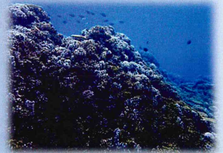
大浦湾(新基地建設現場)のサンゴの写真を展示